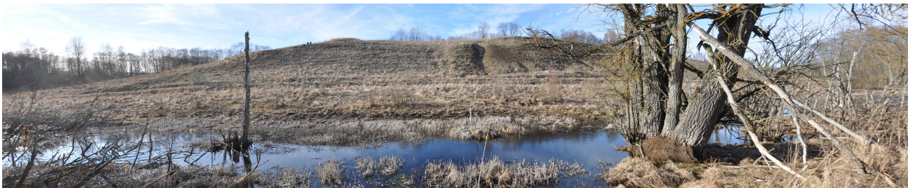
Pav. 1. Garnių piliakalnis I (Utenos r. sav., Daugailių sen.) 2016 metais.