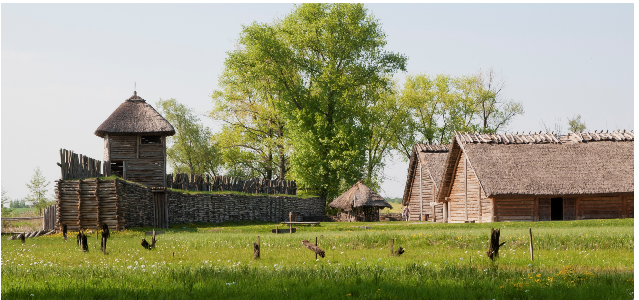
Pav. 4. Biskupine aptiktų pastatų rekonstrukcija. Biskupyno archeologijos muziejus. ( https://upload.wikimedia.org/wikipedia/commons/1/16/Biskupin.jpg )

Ankstyvųjų piliakalnių žemutiniuose sluoksniuose aptikta kuklių užstatymų liekanų – tvorų (Narkūnai, Nevieriškė), vartų (Sokiškiai, žr. 2 pav.) stulpaviečių įgilintų į nejudintą gruntą (žr. 3 pav.). Remiantis tokiomis pastatų liekanomis sunku spręsti apie ankstyviausius pastatus, tačiau rekonstruojamų pastatų ribų, stulpų dydis ir išdėstymas kelių metrų atstumu vienas nuo kito suponuoja, kad ankstyviausi pastatai piliakalniuose galėjo būti statomi panašia technologija, kaip ir vienlaikėje įtvirtintoje Biskupyno (Lenkija) gyvenvietėje (4 pav.), nes būtent tokios konstrukcijos (5 pav.) pastatai palieka panašias aptinkamų stulpaviečių liekanas.