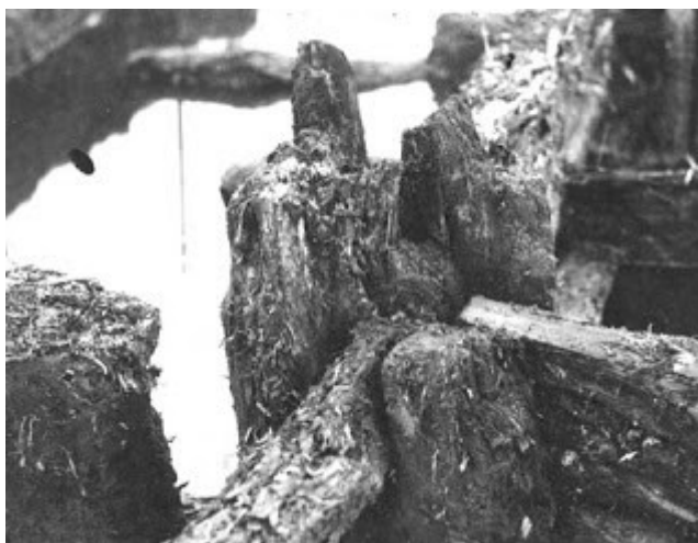
Pav. 5. Tyrimų metu Biskupine užfiksuotų medinių pastatų statybos technologijos leidžia archeologams rekonstruoti, kaip atrodė gyvenvietės VIII a. pr. Kr. ( http://structuralarchaeology.blogspot.lt/2008/12/16-world-of-woos.html )

Žinoma, kad ankstyviausiuose piliakalniuose – įtvirtintose sodybose gyvenę žmonės ŠR Lietuvoje vertėsi gyvulininkyste ir žemdirbyste. Narkūnų ir Garnių I piliakalnių sluoksniuose aptikta daugiausiai kiaulių kaulų, taip pat svarbios buvo avys/ožkos, kai kada galvijai. Apie besivystančią žemdirbystę byloja Narkūnų puodo dugne sorų ( Panicum miliaceum ) įspaudai (6 pav.). Kartu su ankstyviausiais piliakalnių horizontais vienalaikė yra ir ankstyviausios Rytų Baltijos regione vykdytos metalurgijos apraiškos. Gal būt pagausėjus regione bronzinių metalinių dirbinių, bendruomenės pradėjo kaupti vis didesnę turta, kurio apsaugai teko ieškoti naujų būdų?