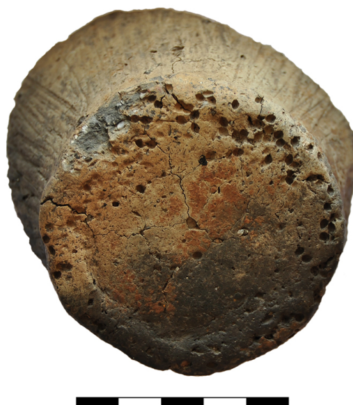
Pav. 6. Brūkšniuoto puodo, aptikto Narkūnų „Didžiajame“ piliakalnyje, dugnas su sorų įspaudais. Vidinėje puodo sienelės pusėje taip pat aptikta kviečio arba miežio įspaudų.

Žinoma, kad ankstyviausiuose piliakalniuose – įtvirtintose sodybose gyvenę žmonės ŠR Lietuvoje vertėsi gyvulininkyste ir žemdirbyste. Narkūnų ir Garnių I piliakalnių sluoksniuose aptikta daugiausiai kiaulių kaulų, taip pat svarbios buvo avys/ožkos, kai kada galvijai. Apie besivystančią žemdirbystę byloja Narkūnų puodo dugne sorų ( Panicum miliaceum ) įspaudai (6 pav.). Kartu su ankstyviausiais piliakalnių horizontais vienalaikė yra ir ankstyviausios Rytų Baltijos regione vykdytos metalurgijos apraiškos. Gal būt pagausėjus regione bronzinių metalinių dirbinių, bendruomenės pradėjo kaupti vis didesnę turta, kurio apsaugai teko ieškoti naujų būdų?