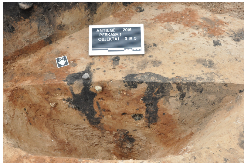
Pav. 3. Pastato stulpavietė fiksuojama archeologinių tyrimų Antilgės (Utenos r. sav., Daugailių sen.) piliakalnio tyrimų metu.

Pietryčių Baltijos regione I t-mečio pr. Kr. pradžioje pradėti apgyvendinti pirmieji piliakalniai Dauguvos upės baseine (Kivutkalnio, Klangukalnio, Vinakalnio Mūkukalnio, ir kt.), taip pat dabartiniame ŠR Lietuvos regione (Dūkštas, Mokšėnai, Petrešiūnai, Narkūnai, Kereliai, Sokiškiai, Nevieriškė, Garniai I (žr. 1 pav.) ir kt.). Panašiu laikotarpiu atsiranda pavieniai piliakalniai ir V Lietuvoje (Kurmaičiai, Dapšiai), V Latvijoje (Krievukalns, Klosterskalns) bei ŠR Lenkijoje (ankstyviausias žmonių palikimas Žubronajcie, Szurpiły, Tarlawki ir kt. piliakalniuose).