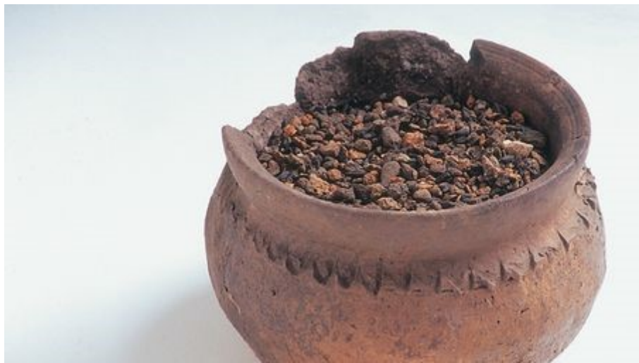
Puodynė su grūdų liekanomis iš Maišiagalos piliakalnio