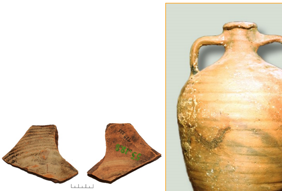
Pav. Mažulonių piliakalnyje rastos amforos fragmentai ir analogiškas indas iš Juodosios jūros regiono.

2009-2010 m. vykdant projektą „Archeologinių lituanistikos išteklių sąvado sudarymas ir skaitmeninimas“, Ermitažo muziejuje atlikta Mažulonių keramikos kolekcijos analizė. Tarp šukių aptiktas išskirtinis Lietuvos archeologinės medžiagos radinys – importuotos amforos fragmentas . Indas gamintas iš negausiai labai smulkiomis mineralinės kilmės priemaišomis liesinto molio. Išorinėje indo pusėje žiedimo metu suformuoti ranteliai. Degtas oksidacinėje aplinkoje, aukštoje temperatūroje. Išorinė amforos pusė išraižyta. Rastojų fragmento dalyje identifikuojamas „T“ raidės formos įrėžimas. Mažulonyse rastos amforos fragmentas nedidelis, indo forma neatkuriama. Dėl šios priežasties neįmanoma nustatyti amforos tikslios kilmės vietos bei laiko. Panašios raudono molio amforos sutinkamos Rusijos miestuose, dažniausiai X-XIII a. datuojamuose kultūriniuose sluoksniuose, ir kildinamos iš Juodosios jūros regionų. XI-XII a. datuojamos amforos žinomos iš Latvijos Koknesės bei Asotės piliakalnių. Mažulonių piliakalnio amforos fragmentas, pagal kitus radinius datuojamas X - XII a. pab./XIII a.